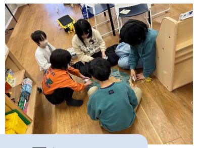
冬休みはコマ回し 坊主めぐりで大はしゃぎ！